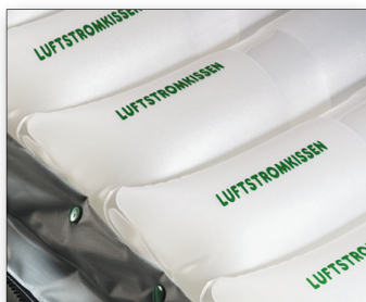
Vzduchové cely vyrobené z kvalitního polyuretanu